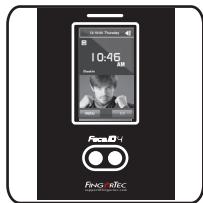
Face ID 4d