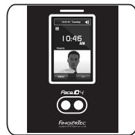
Face ID 4