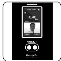
Face ID 4