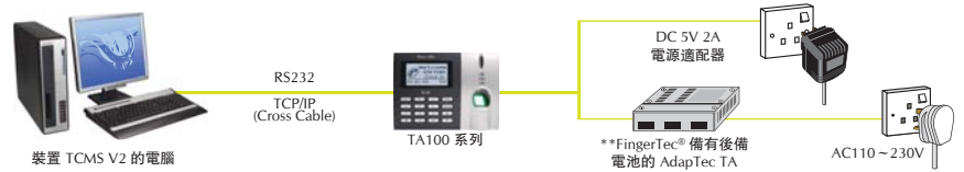
示意圖 (單機操作系統)