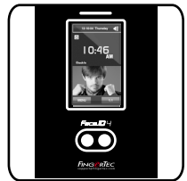
Face ID 4d