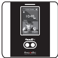
Face ID 4d