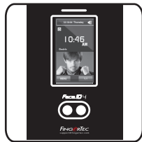
Face ID 4d