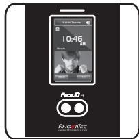
Face ID 4d