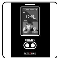
Face ID 4d