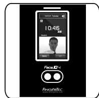
Face ID 4