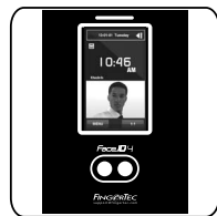
Face ID 4