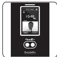
Face ID 4