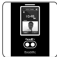
Face ID 4