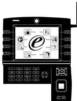
i-Kiosk 100 Plus