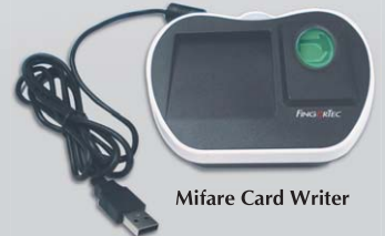
Mifare Card Writer